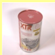
BARDAHL XTR C60 RACING OIL 20W-60 1 Liter Dose

Viel Spaß beim modernen Einkauf in unserem Shop.